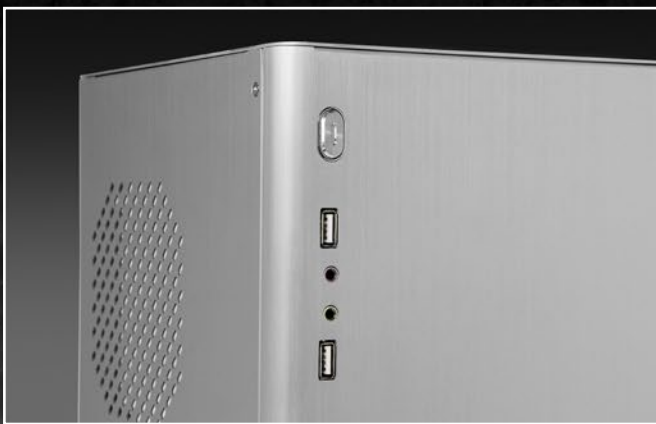
Front-I/O: 2x USB2.0, 2x Audio