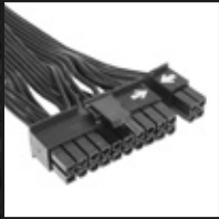
1x 20+4 ピン メインボードコネクタ