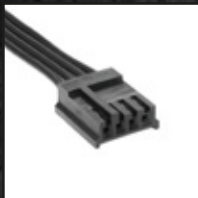
1x フロッピー 電源コネクタ