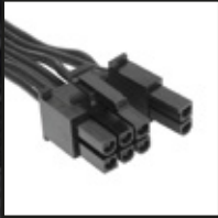
2x 6+2 ピン PCIe コネクタ