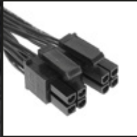
1x 4+4 ピン CPU 電源コネクタ