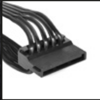
4x SATA 電源コネクタ