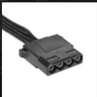
2x 4 ピン IDE 電源コネクタ